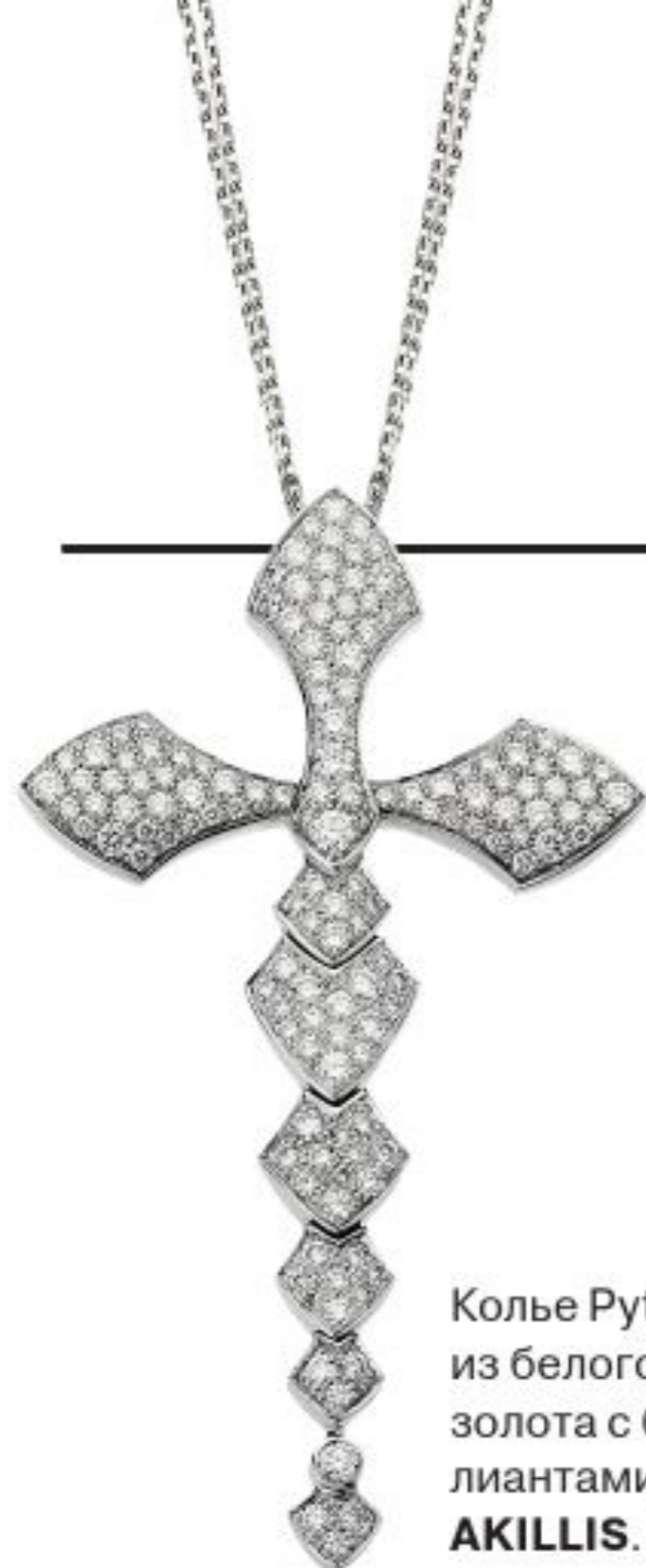
Колье Python из белого золота с бриллиантами, AKILLIS .