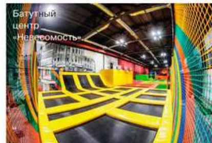
Батутный центр «Невесомость»