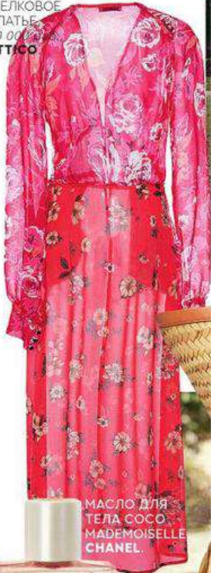
МАСЛО ДЛЯ ТЕЛА СОСО МАДЕМОИСЕЛЛЕ CHANEL