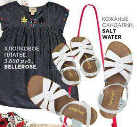
ХЛОПКОВОЕ ПЛАТЬЕ, 3 600 руб., BELLEROSE