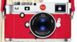
КАМЕРА LEICA M A LA CARTE, 680 000 руб., LEICA