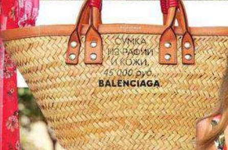
СУМКА ИЗ РАПИИ И КОЖИ, 45 000 руб., BALENCIAGA