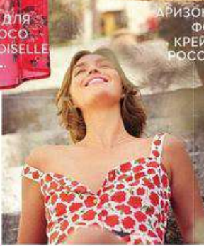
АРИЗОНА МЬЮЗ.

АМОРЕ МИО Мое вдохновение – съемка Vogue, которую мы сделали когда-то в Таормине с Аризонай Мьюз: платья с пышными юбками и алыми звездами буду носить с сумкой из соломки.