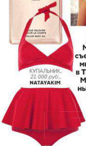
КУПАЛЬНИК, 21 000 руб., НАТАЯКИМ