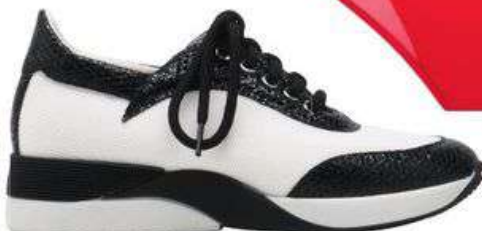
Кроссовки из кожи тельяны и кожи змеи, MAX MARA.