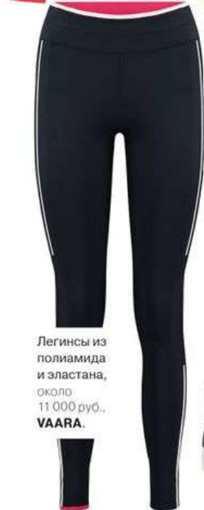
Легинсы из полиамида и эластана, около 11 000 руб., VAARA.