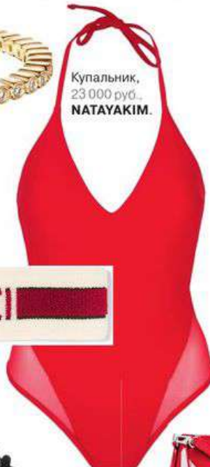
Купальник, 23 000 руб., NATAYAKIM.