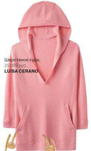
Шерстяное худи, 25 099 руб., LUISA CERANO.