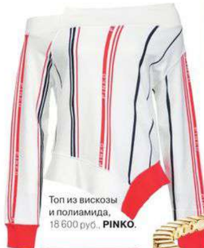
Топ из вискозы и полиамида, 18 600 руб., PINKO.

Мужья, любовники, «Оскары», стиль. Джейн Фонде уже восемьдесят, а она до сих пор богиня спортзалов.