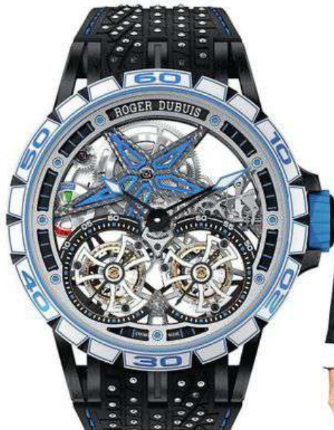
Часы Excalibur Spider Pirelli Sottozero из титана с белой керамикой, ROGER DUBUIS .

Новых часов Roger Dubuis с грозным названием Excalibur Spider Pirelli Sottozero и двойным «парящим» турбийоном в мире всего восемьдесят восемь. Корпус сделан из сапфирового стекла, а на ремешке — титановые шипы из шин Pirelli, снятых с раскаленных колес победителей гонок по льду и снегу.