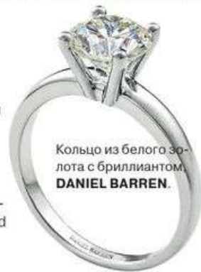
Кольцо из белого золота с бриллиантом, DANIEL BARREN .

В салон часов и ювелирных радостей Da Vinci в Смоленском пассаже прибыли кольца и серьги из новой коллекции Daniel Barren с российскими природными бриллиантами весом от 0,33 до 4 каратов. Награды за вклад в эстетический облик страны можно купить еще и в бутике Ambassador в «Рэдиссон Ройал», то есть бывшей гостинице «Украина».