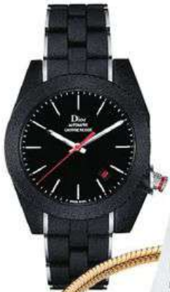
Часы Chiffre Rouge из стали и каучука, DIOR HORLOGERIE.