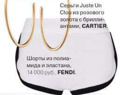
Серьги Juste Un Clois из розового золота с бриллиантами, CARTIER.