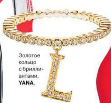
Золотое кольцо с бриллиантами, YANA.