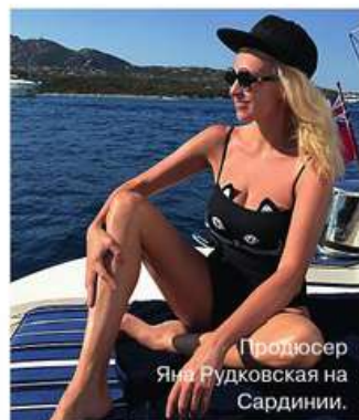
Продюсер Яна Рудковская на Сардинии.