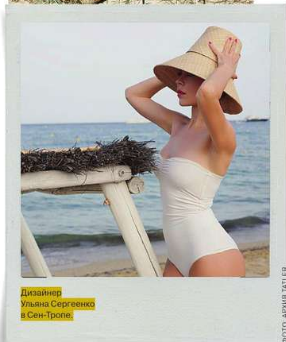
Дизайнер Ульяна Сергеенко в Сен-Тропе.