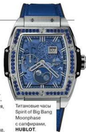
Титановые часы Spirit of Big Bang Moonphase с сапфирами, HUBLOT.

В тона праздничного фейерверка окрасились часы Spirit of Big Bang Moonphase швейцарской марки Hublot. Есть розовые, оранжевые, сиреневые, синие — какой салют над Тремя долинами сегодня, такие и надевайте. Блеск в глазах поддерживает сапфиры и аметисты на безеле.