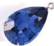
Колье Classic из белого золота с бриллиантами и кулон Color из белого золота с сапфиром, MERCURY.

ЮВЕЛИРНАЯ МАРКА Mercury ПОПОЛНИЛА СВОЮ КОЛЛЕКЦИЮ УКРАШЕНИЯМИ ДЛЯ СНЕЖНЫХ КОРОЛЕВ. ИЗ КОЛЬЕ СО СТА ПЯТЬЮ (ИЛИ ТРЕМЯСТАМИ) БРИЛЛИАНТАМИ И КУЛОНОВ ИЗ ВОСЬМИКАРАТНЫХ САПФИРОВ ОТЛИЧНО СКЛАДЫВАЕТСЯ СЛОВО «ВЕЧНОСТЬ».