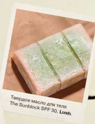
Твердое масло для тела The Sunblock SPF 30, Lush .