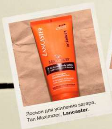
Лосьон для усиления загара, Tan Maximizer, Lancaster .

Купальник из полиамида и эластана, Natayakim ; шелковый платок, Gucci ; серьги Mosaic из розового золота с бриллиантами, de Grisogono .