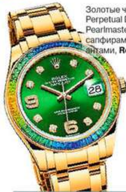
Золотые часы Oyster Perpetual Datejust Pearlmaster с цветными сапфирами и бриллиантами, Rolex.