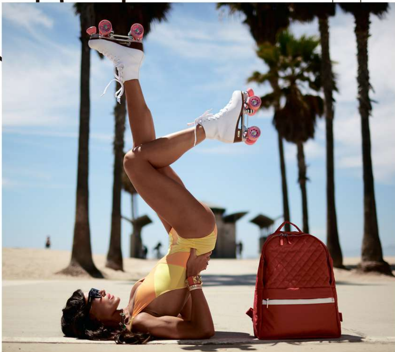
Купальник NATAYAKIM , очки Tom Ford , кольцо и браслет Van Cleef & Arpels , браслеты Hermès , рюкзак Chanel